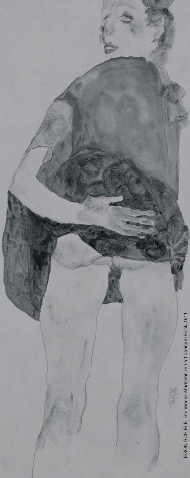
EGON SCHIELE, Stehendes Mädchen mit erhobenem Rock, 1911